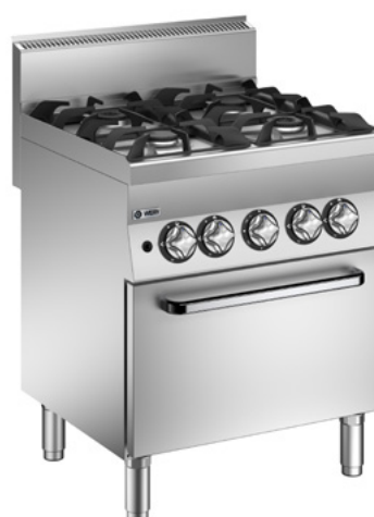
Bilden visar modell CFG67