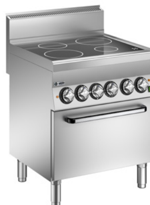
Bilden visar modell CFVE67