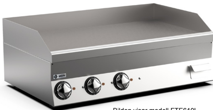
Bilden visar modell FTE610L