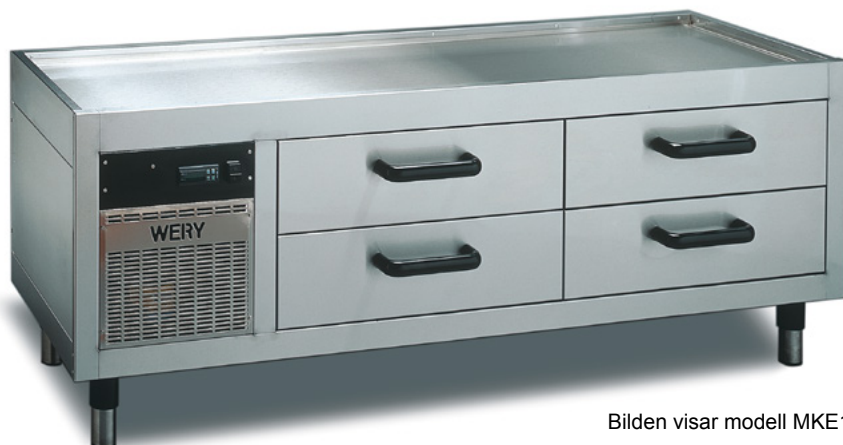
Bilden visar modell MKE16