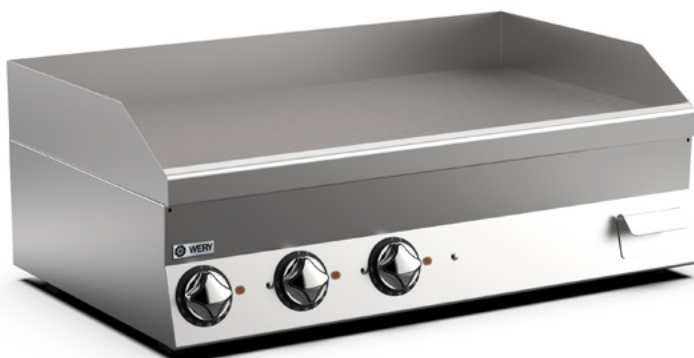
Bilden visar modell FTE610L