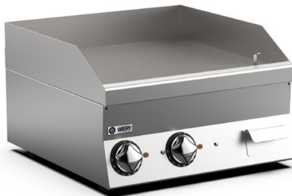
Bilden visar modell FTE66L