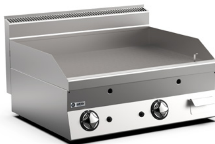
Bilden visar modell FTG68L