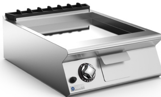
Bilden visar modell NFT7-6GTLO med kromad stekyta