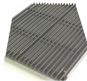
TILLVAL: Gjutjärnsgaller AGR74GGKM